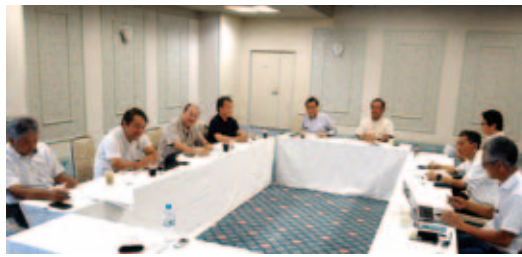
常務理事会の様子

厚生労働省「団体等検定制度」の認定取得についても、運営組織の中に実施計画や規程関係、試験基準、実施体制に取り組む専門部会を設置することを決定しました。