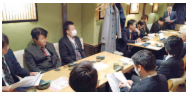
南関東支部総会の模様

▼北海道支部=3月5日/函館開陽亭すすきの店(札幌市) ▼東北・北関東支部=3月4日/東天紅(さいたま市) ▼東京支部=3月7日/全管協事務局 ▼南関東支部=2月20日/うらめし屋平じ(小田原市) ▼中部・北陸支部=2月12日/イオンコンパス会議室(名古屋市) ▼近畿支部=2月21日/新大阪丸ビル別館(大阪市) ▼中国・四国支部=2月6日/酒膳皿蛭槍(高知市)